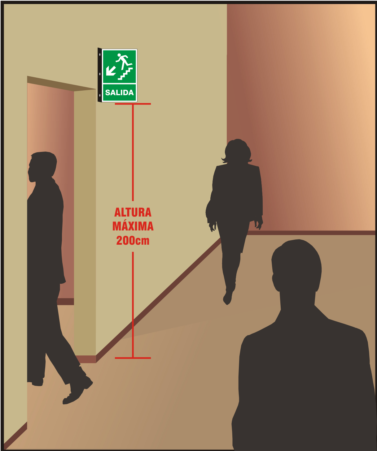
DIBUJO 1 - INSTALACIÓN DE CARTEL DE EVACUACIÓN (TIPO BANDERA).